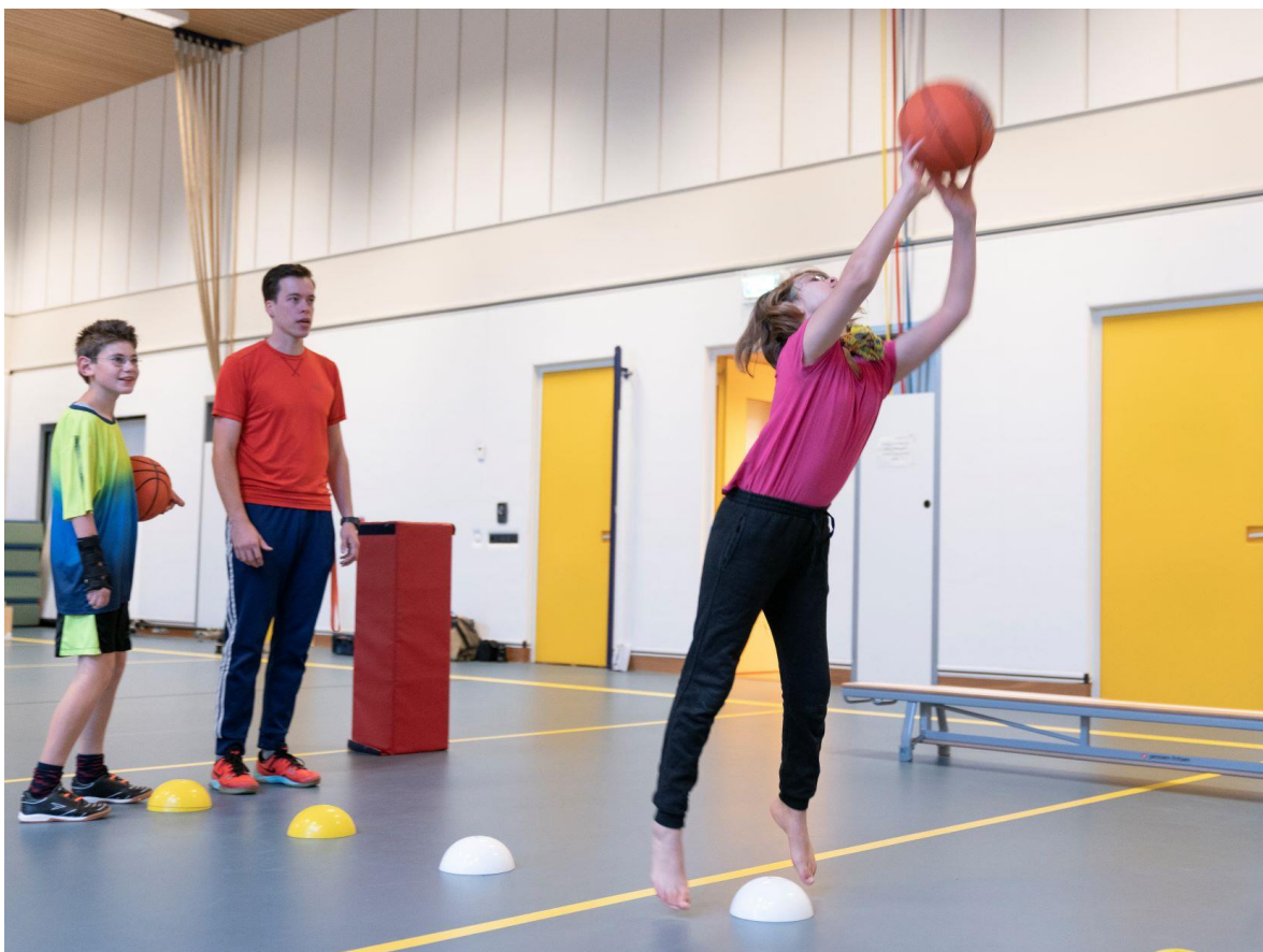
Basketbal doelen in de les bewegingsonderwijs

Het is de gewoonte dat de leerlingen bij de lessen bewegingsonderwijs sportkleding dragen (gymshirt, gymbroek, gymschoenen met klittenband of instappers). Als leerlingen zelf veters kunnen strikken, dan mogen veterschoenen ook. Leerlingen voor wie omkleden een te grote belasting vormt, hoeven alleen een gymshirt te dragen. Leerlingen met aangepaste schoenen of leerlingen die in een rolstoel zitten hoeven geen gymschoenen te dragen. Na de gymles is er geen douche moment. Wel is het prettig als er deodorant meegegeven wordt. Wij gaan ervan uit dat de gymkleding regelmatig thuis gewassen wordt. U kunt bij de vakleerkracht bewegingsonderwijs terecht als u vragen heeft.